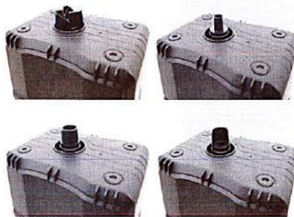
Quatre adaptateurs de chargeur